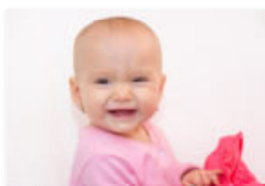
Ohrlochstechen beim Kleinkind: Niedlich oder...