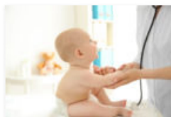
Kindervorsorgeuntersuchungen: U1 bis Halt mich: Das sind die beliebtesten Stillpositionen